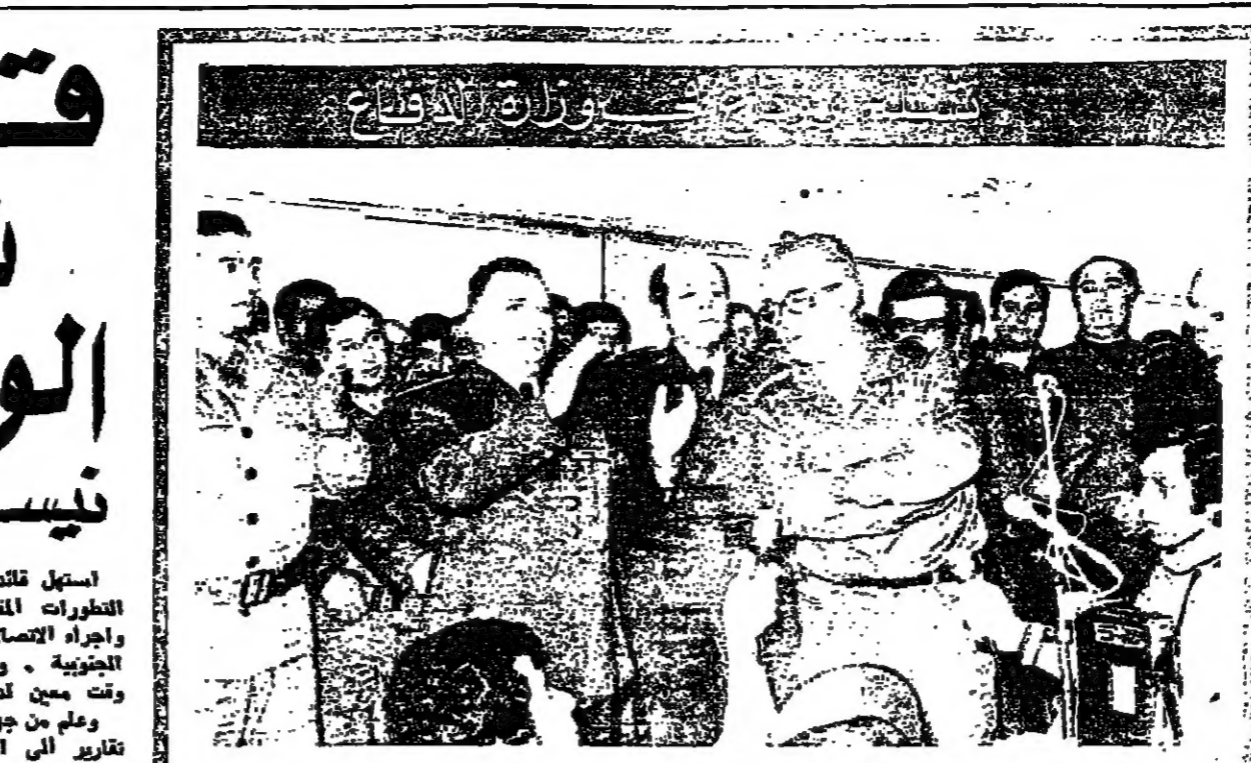
قائد الجيش الجديد يقبله القائد السابق بسبق